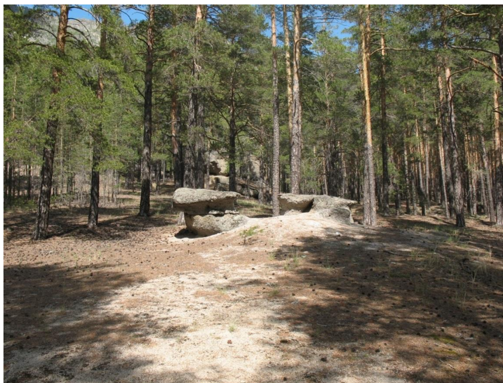
Рис. 2 – Участок со скальным отложением