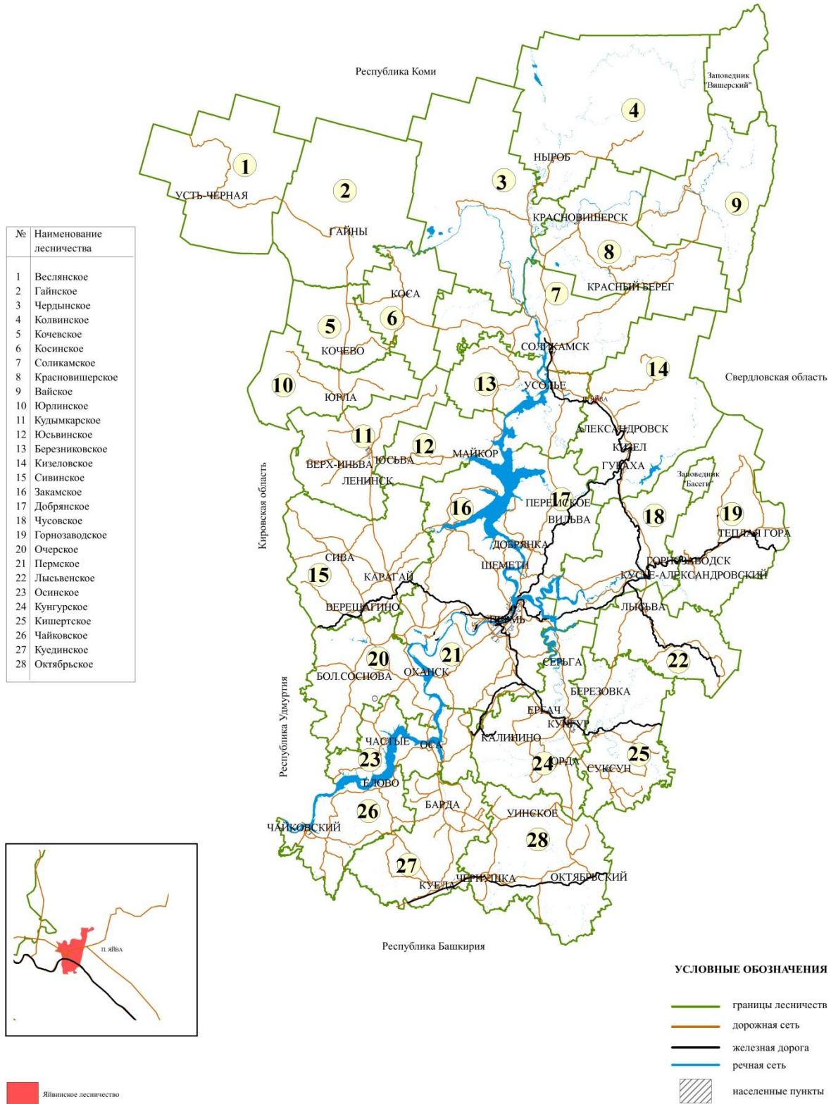
Карта-схема Пермского края с выделением территории Яйвинского лесничества