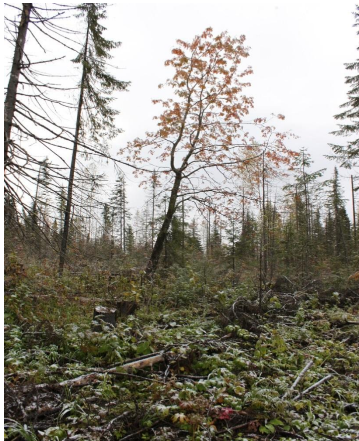
Рис. 4 – Рябина обыкновенная (древовидная форма)