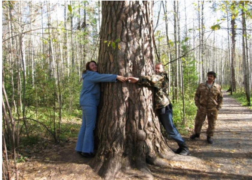
Рис. 1 – Старовозрастное дерево