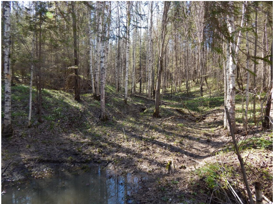
Рис. 3 – Участок леса вдоль временного (пересохшего) водотока с выраженным руслом