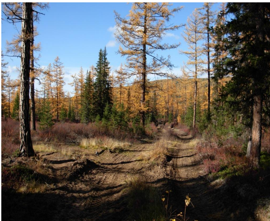
Рис. 7 – Группа деревьев лиственницы Сукачева ( Larix sukaczewi N. Dul.)