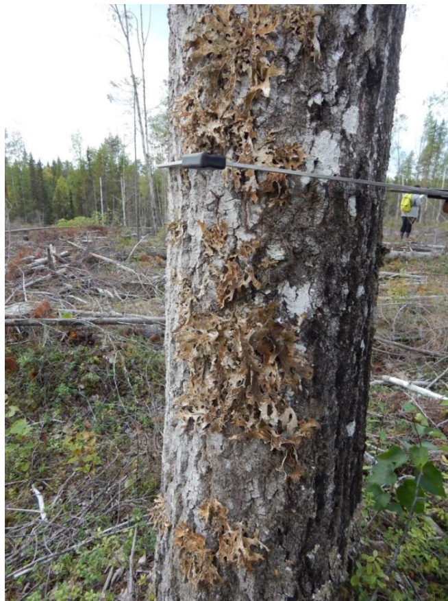
Рис. 10 – Осина с лишайником лобария легочная ( Lobaria pulmonaria ) на стволе (вид лишайника, занесенный в Красную книгу)