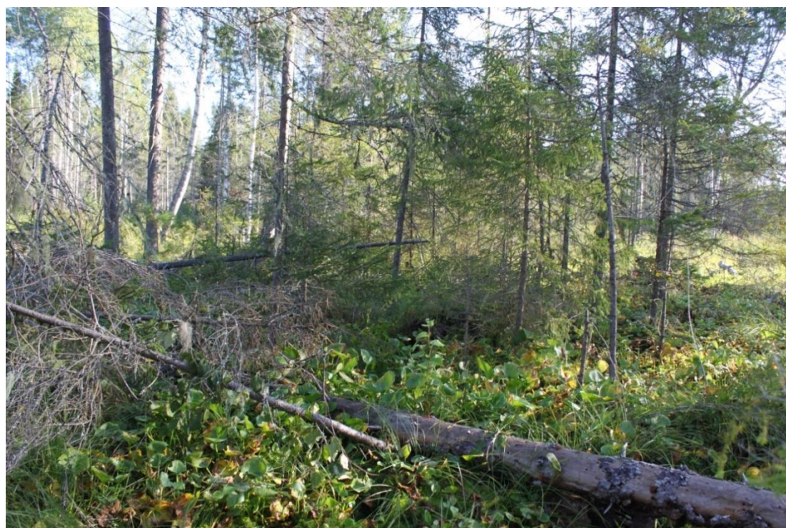
Рис. 8 – Окна распада древостоя с естественным распадом и валежом