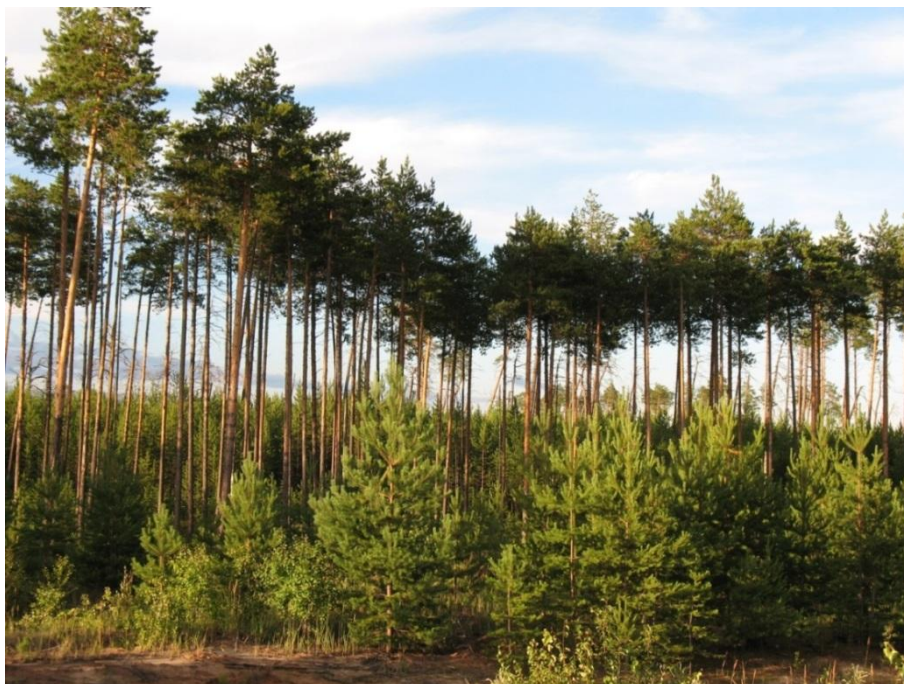
Рис. 6 – Опушка леса на границе с безлесным участком