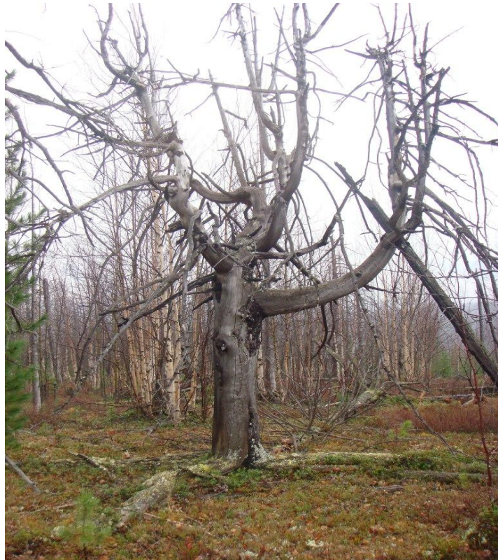
Рис. 6 – Единичное сухостойное дерево