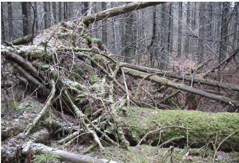
Рис. 7 – Крупный валеж