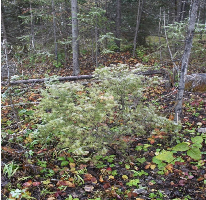
Рис. 3 – Можжевельник обыкновенный