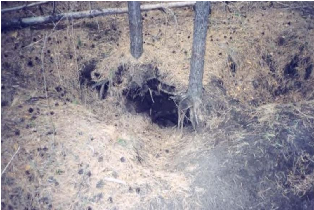
Рис. 9 – Участок леса в местах норения барсуков