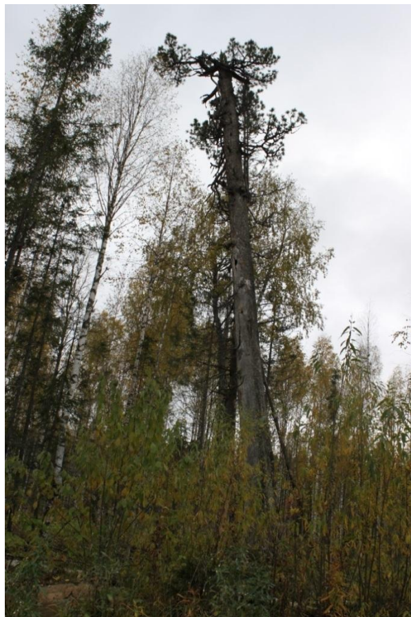
Рис. 2 – Единичное дерево кедра сибирского (сосны сибирской) ( Pinus sibirica Du Tour.)