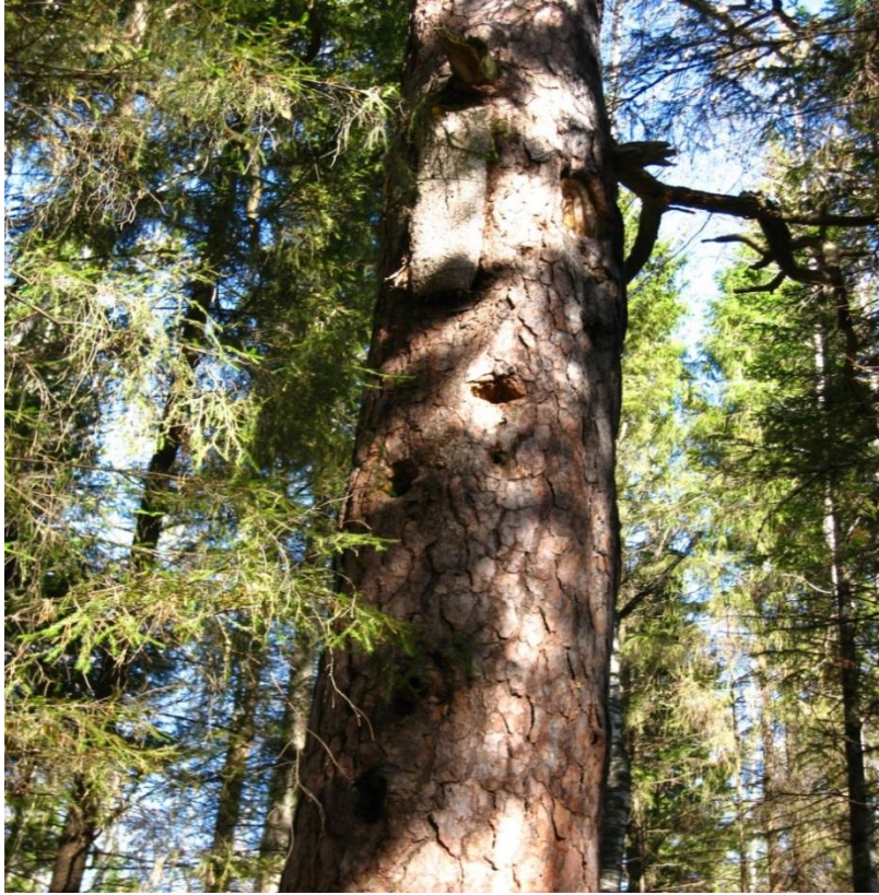
Рис. 5 – Дерево с дуплом