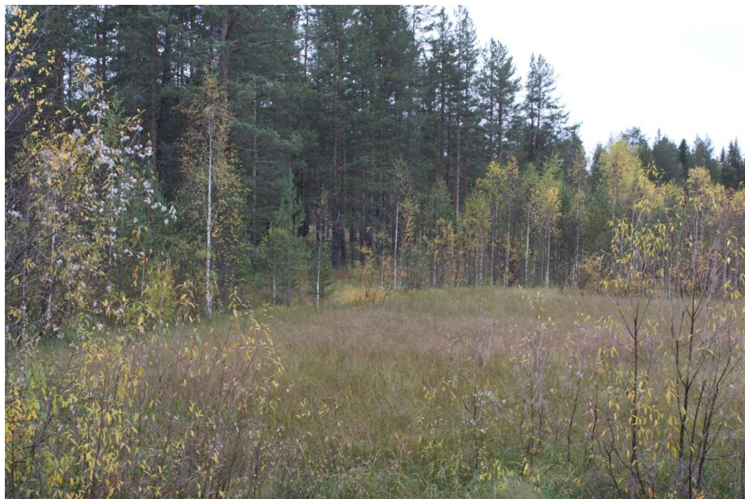
Рис. 1 – Окраина болота