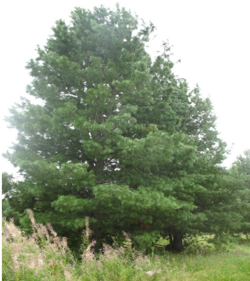
Рис. 5 – Биогруппа сосны сибирской (кедра сибирского) ( Pinus sibirica Du Tour.)