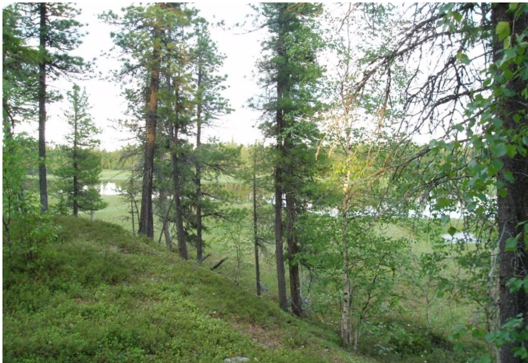
Рис. 4 – Участок леса на крутосклоне